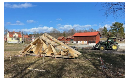
Takstolarna på plats vid Norrgården

Ingen lätt match att få allt dit men med ett gäng positiva, arbetsvilliga och lösningsorienterade personer, tillsammans med traktorer, fick vi allt på plats till kvällen, utan vare sig missöden eller skador. Stort tack till oss alla!