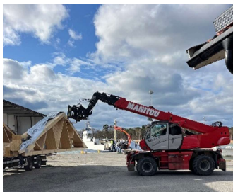
Lossning & lastning vid Åsättra

I onsdags, 9 april, levererades takstolar och limträbalkar. Bilen från takstolsfabriken i Piteå anlände till Åsättra kl. 8 på morgonen för omlastning till fraktfärjan till Ingmarsö. Allt gick perfekt och redan kl.10 var färjan angjord vid Södra Ingmarsö för avlastning och vidare transport till Norrgården.